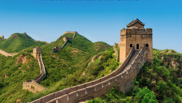
Grande Muralha da China