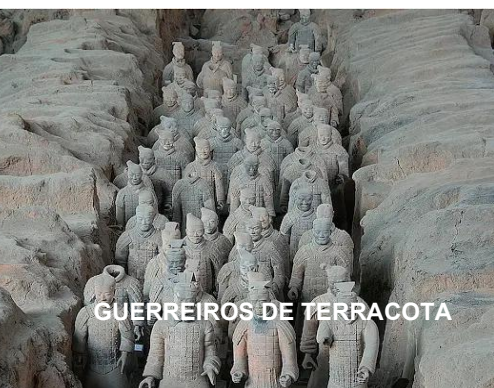
GUERREIROS DE TERRACOTA