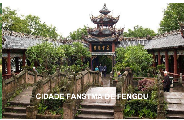
CIDADE FANSTMA DE FENGDU