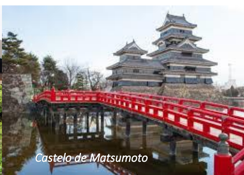
Castelo de Matsumoto