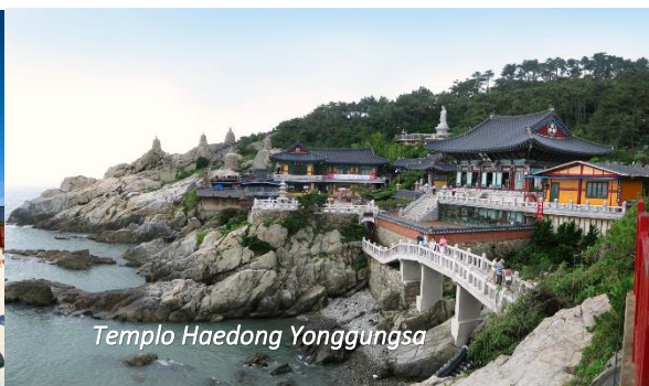
Templo Haedong Yonggungsa