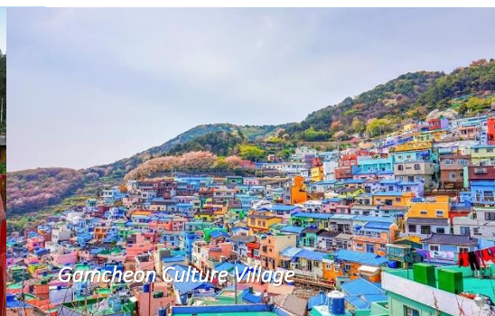
Gamcheon Culture Village