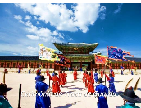
Cerimônia de Troca de Guarda