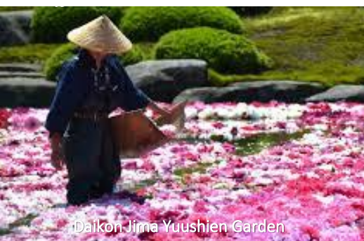
Daikon Jima Yuushien Garden