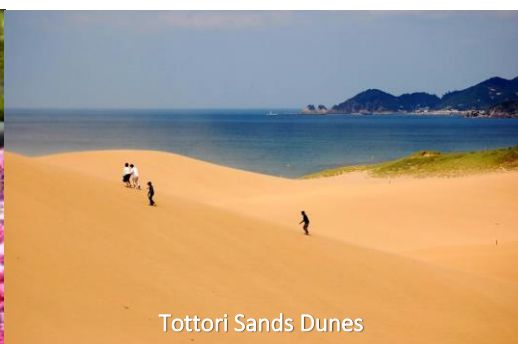
Tottori Sands Dunes