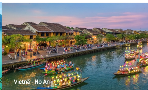
Vietnã – Hoi An