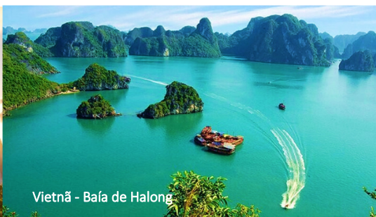
Vietnã – Baía de Halong