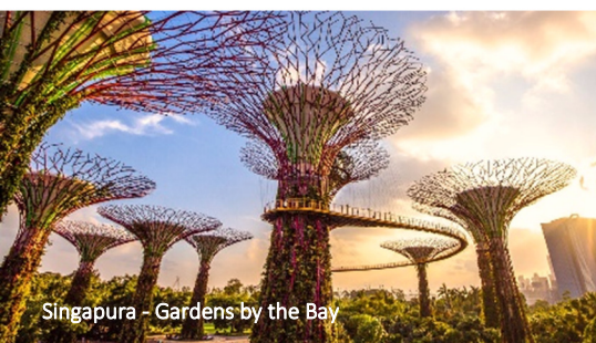
Singapura – Gardens by the Bay