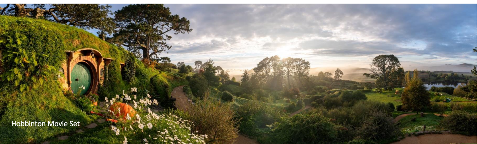
Hobbinton Movie Set