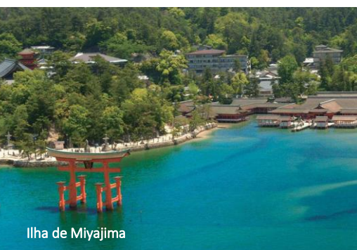
Isla de Miyajima